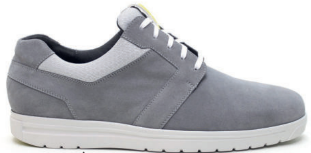
1503.8459 Licht grijs