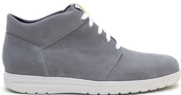
1505.7736 Licht grijs