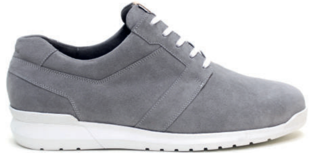
1502.8451 Licht grijs